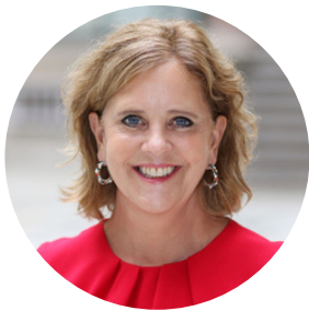
Dame Menna Rawlings Ambassadrice Britannique en France

En mars 2025, à l'occasion de la journée internationale des droits des Femmes, l'ambassade britannique en France invitera trois jeunes filles à accompagner, pour une journée, un.e des trois Ambassadrices.eurs britanniques en France: