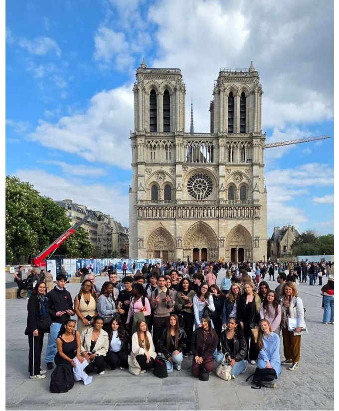
Illustration 4 : Notre-Dame