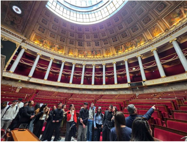
Illustration 3 : Assemblée nationale