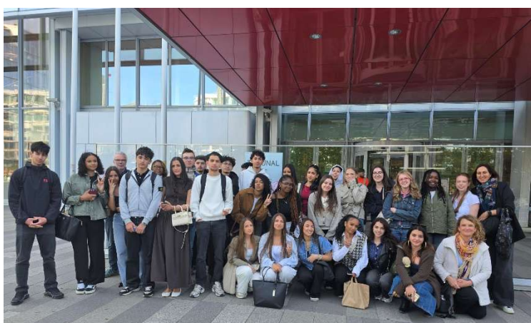
Illustration 2 : Tribunal de Paris